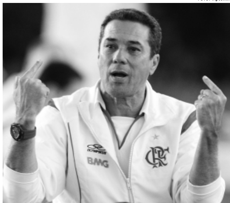
Vanderley Luxemburgo não terá Alex Silva e Ronaldinho contra o América