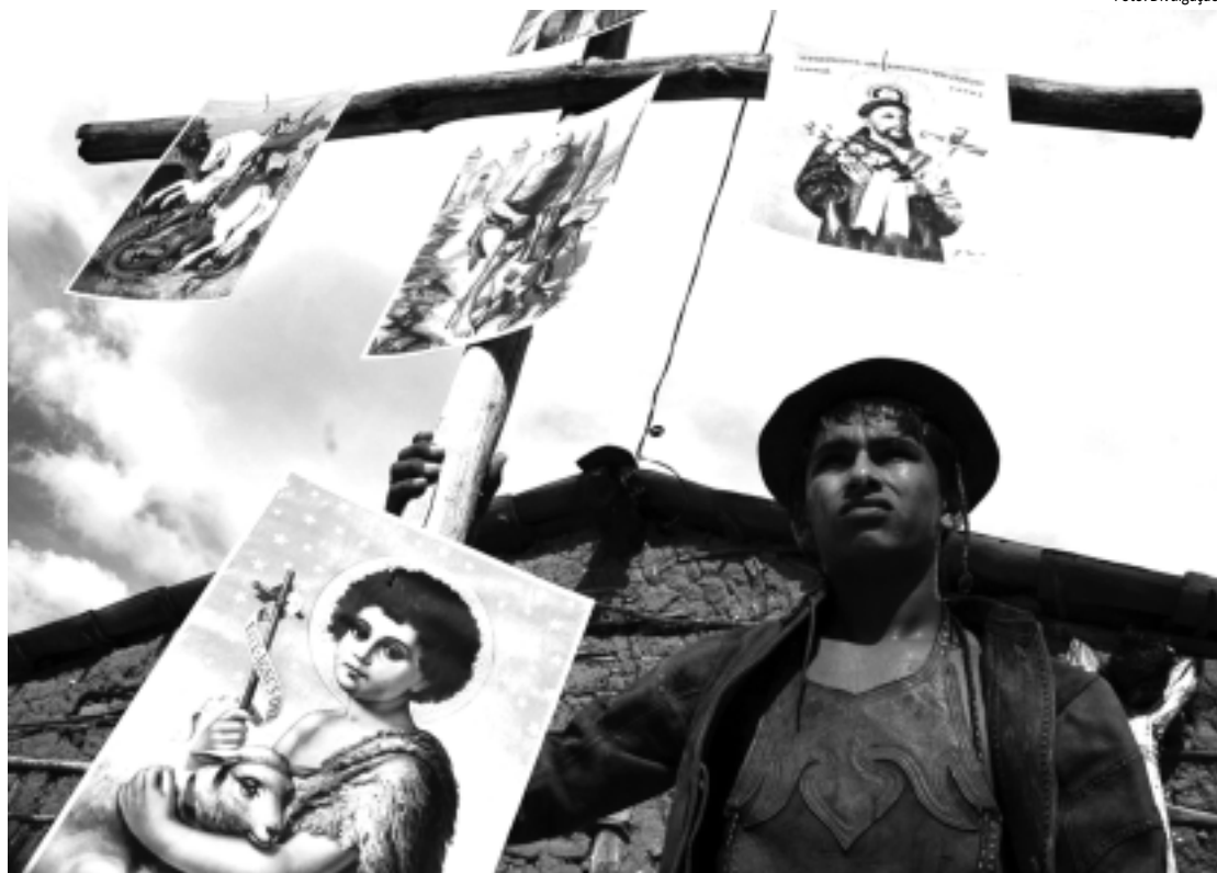
Foto de Aurílio Santos que integra uma das exposições do Projeto Setembro Fotográfico na Estação Cabo Branco

"O que mais impressionou nos portfólios avaliados foi a busca por uma visão pessoal e