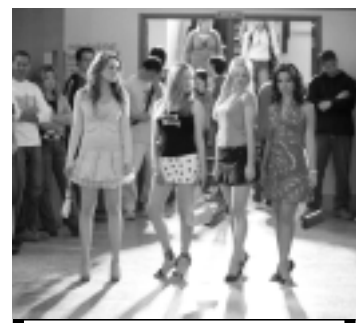
Meninas Malvadas hoje no SBT