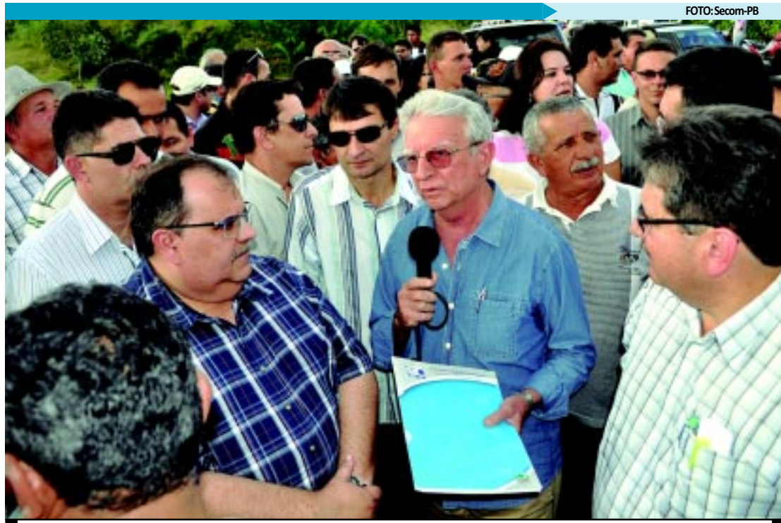
Governador em exercício visitou a ponte para verificar as condições da obra que será entregue em abril próximo

COMPROMISSO - Os ODM pretendem diminuir a desigualdade social e melhorar a qualidade de vida em todo o mundo, por meio de ações nos 191 países comprometidos, entre eles o Brasil. Até 2015, todos os Estados-Membros das Nações Unidas assumiram o compromisso de erradicar a extrema pobreza e a fome; atingir o ensino básico universal; promover a igualdade entre os sexos e a autonomia das mulheres; reduzir a mortalidade na infância; melhorar a saúde materna; combater o HIV/Aids, a malária e outras doenças; garantir a sustentabilidade ambiental e estabelecer uma Parceria Mundial para o Desenvolvimento.