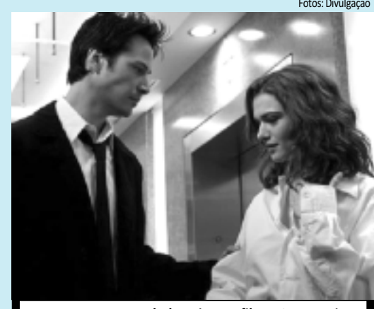
Keanu Reeves e Rachel Weisz no filme Constantine

>>> CONSTANTINE - Nascido com um dom que não desejava - a capacidade de reconhecer claramente os anjos e os demônios híbridos que andam pela Terra com aparência humana -, John Constantine tirou a própria vida para escapar do tormento de suas visões, mas ressuscitou contra sua vontade. Ele ajuda a policial Angela Dodson a solucionar a misteriosa morte de sua irmã gêmea e é levado para o mundo de demônios e anjos que existe sob Los Angeles. SE LIGUE: Hoje, às 21h, no Warner