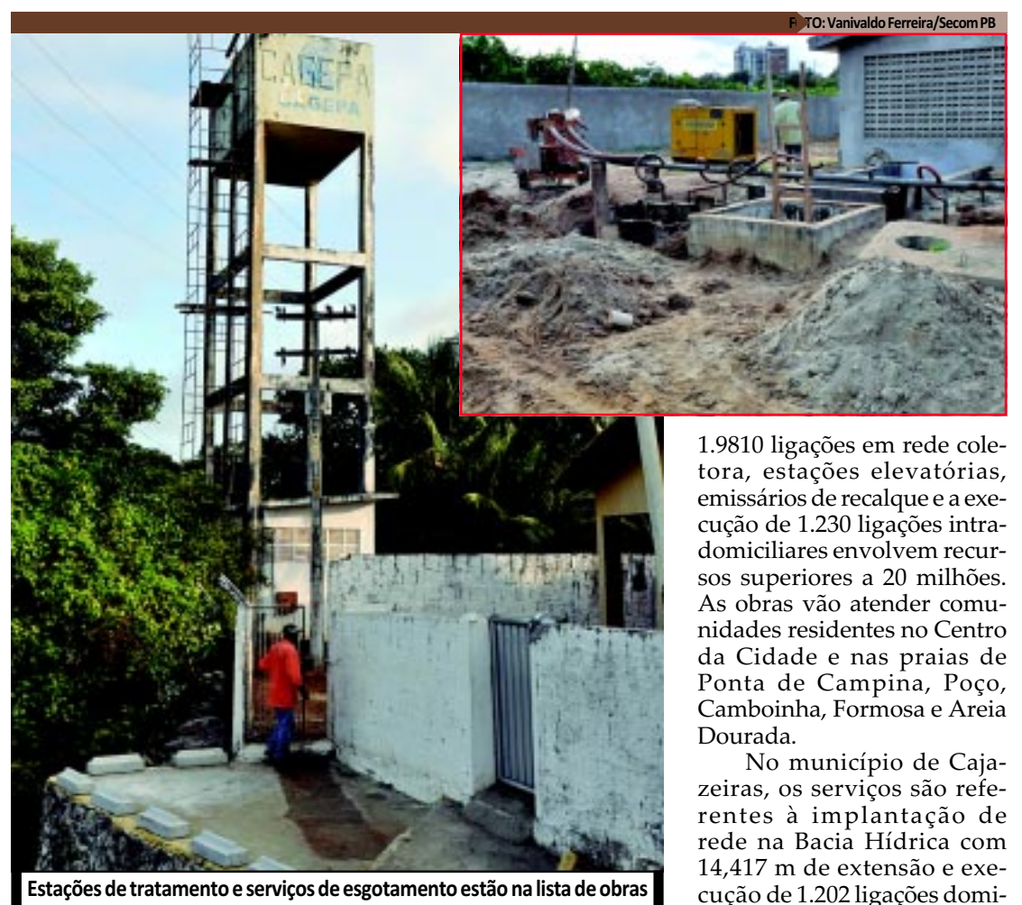
Estações de tratamento e serviços de esgotamento estão na lista de obras

Nos Funcionários I, Laranjeiras (José Américo) e Jardim Ester os investimentos chegam a cerca de R$ 9 milhões. Nos Funcionários I, os serviços contemplam a implantação de uma rede coletora e ligações domiciliares. No Jardim Ester, além de rede coletora e ligações, também está sendo construído um emissário