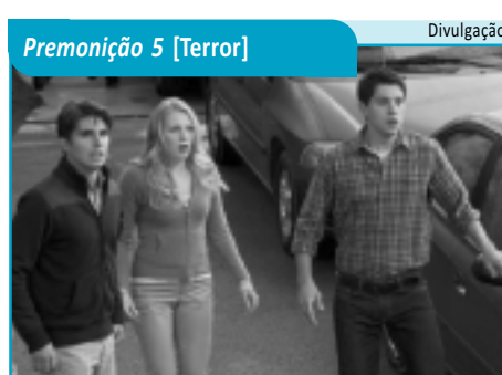
Premonição 5 [Terror]

OSSMURFS (The Smurfs, EUA/Bélgica, 2011). Gênero: Duração: 105 min. Classificação: Livre. Dublado e legendado. Direção: Raja Gosnell, com Neil Patrick Harris, Alan Cumming, Katy Perry, George Lopez, Sofia Vergara. Gargamel descobre o povoado mágico dos Smurfs e faz com que eles se dispersem na floresta. Na fuga, eles entram na gruta proibida que os leva para o Central Park. Eles tentam voltar para casa são ajudados por um casal. Tambiá 1: 16h15 e 20h15.